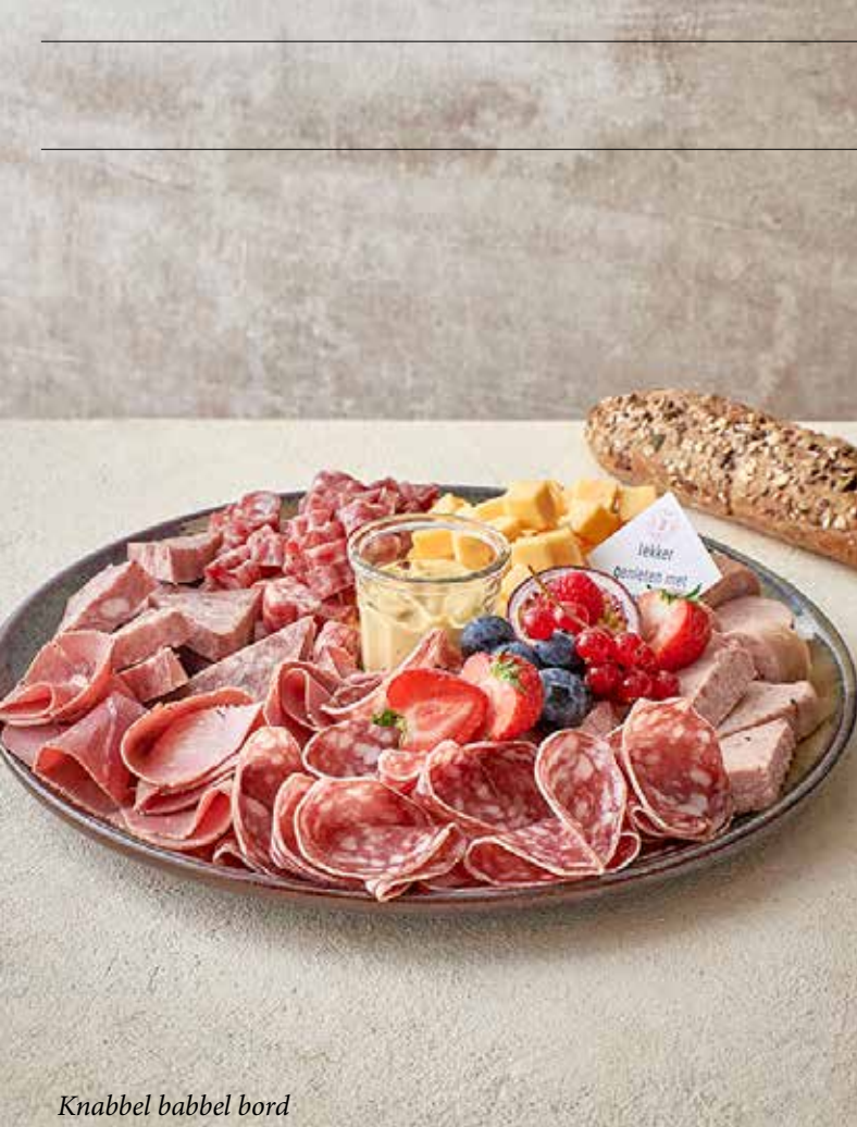
Knabbel babbel bord