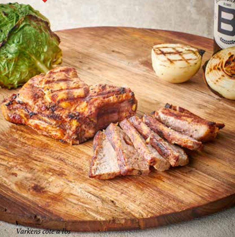
Varkens côte à l'os