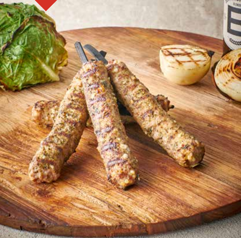
BBQ Lolly huismarinade